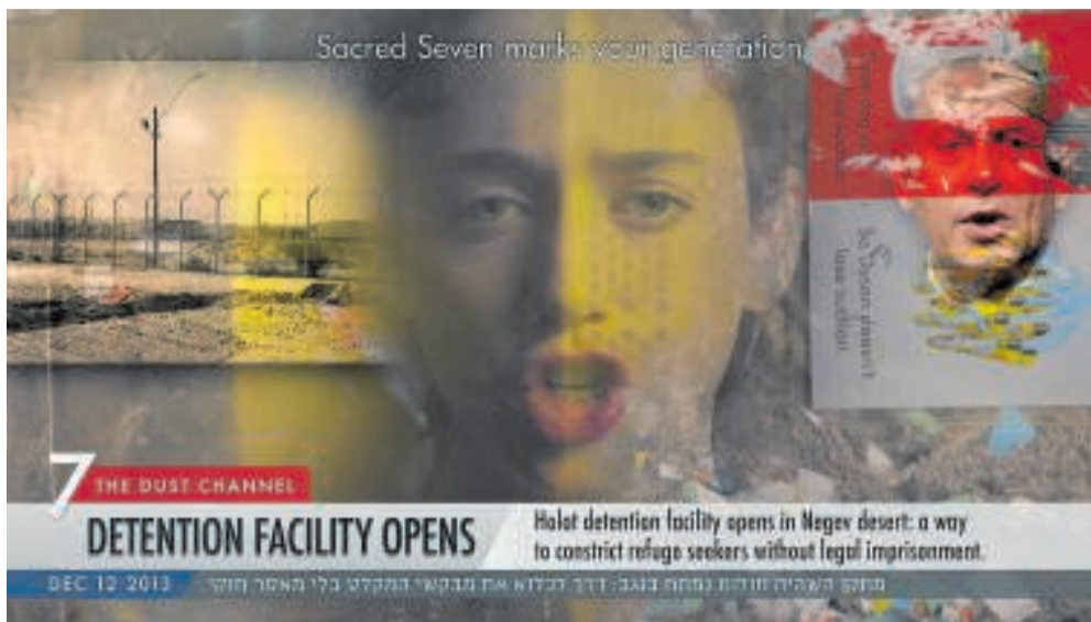
▲ Udstillingens første rum er opbygget som en biograf, hvor publikum kan hvile sig i biografstolene og opleve det lige dele underholdende og skræmmende filmværk "The Dust Channel" (2016), der blandt andet indeholder tv-klip, som beretter om antallet af asylansøgere i Israel og viser billeder af sand og grænsehegn omkring asyl-detentionen Holot i den israelske ørken. – Foto: Still fra "The Dust Channel"/Roe Rosen.

Filmen "The Dust Channel" er opbygget som en velarrangeret operette, hvor et pars